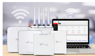
Sicheres, cloud-verwaltetes WLAN